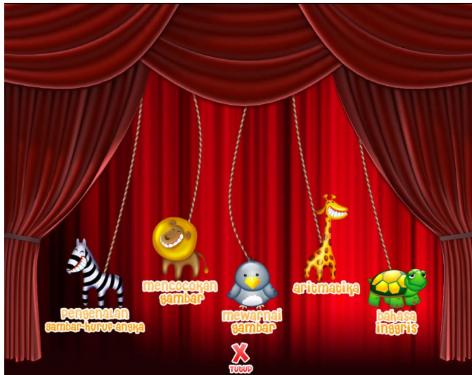
Gambar 2: Menu utama.

Dari tampilan depan menuju ke form menu :