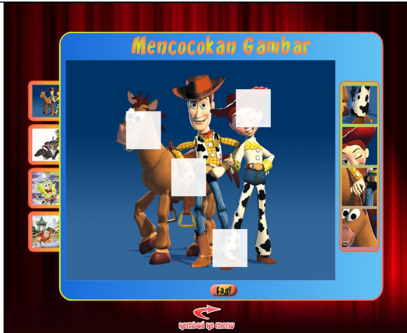
Gambar 4: Menu Mencocokkan gambar