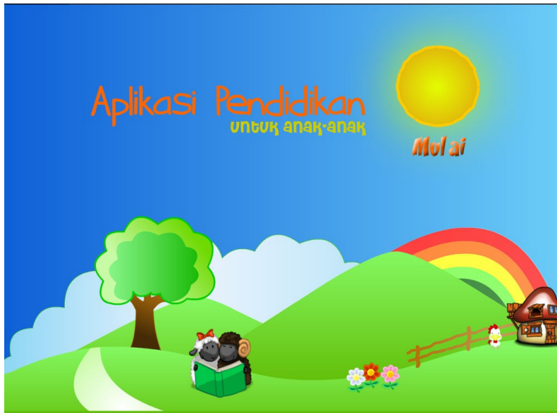
Gambar 1: Tampilan depan program.

Penyajian hasil penelitian akan menyajikan tampilan-tampilan hasil pembuatan CD interaktif sebagai berikut :