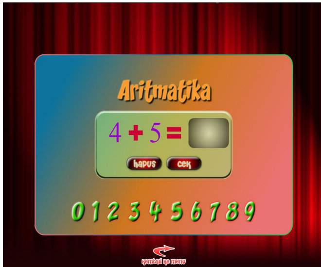
Gambar 5: Menu Aritmatika