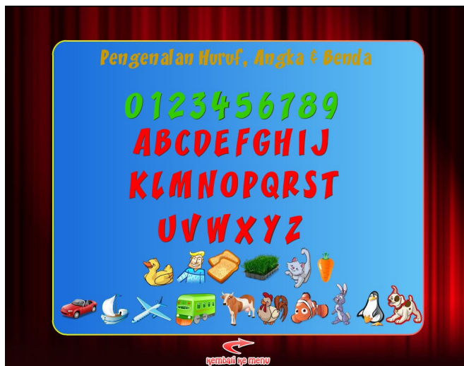
Gambar 3: Menu Pengenalan Huruf, Gambar, Angka.